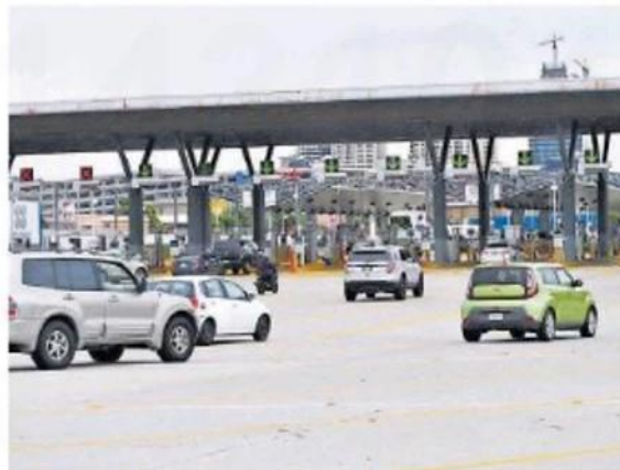
Para la Secretaría de Economía Sustentable y Turismo, Semana Santa será un ensayo para lo que viene el próximo verano, en el cual se prevé mayor afluencia de turistas.